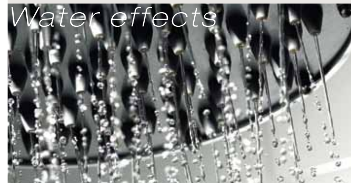
Doccia a diluvio / Torrential rainshower