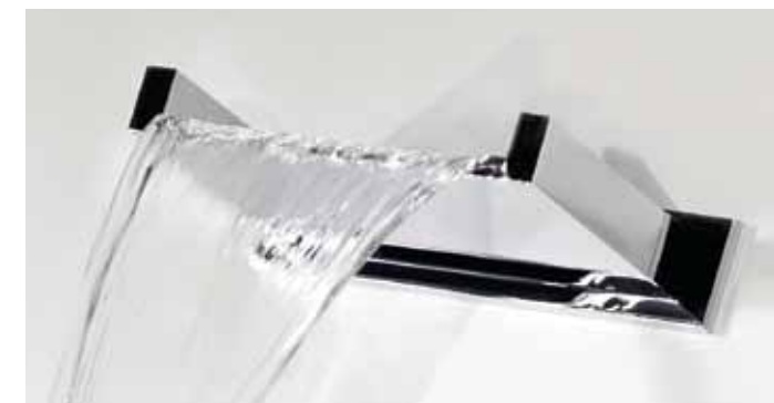
Cascata d'acqua / Waterfall

The suggestive wooden bucket recalls the ancient after-sauna ritual. Very useful in a wellness centres to refresh intensely and quickly the body, as to obtain a revitalizing and strengthening effect on the immunitary system. The 10-litre wooden bucket, completely waterproof, has a stand for wall or ceiling fixing, a connection for the water supply and a float for the automatic refilling. The bucket is automatically refilled with cold water. Pulling the 65 cm long chain, the water falls down, over the person below.